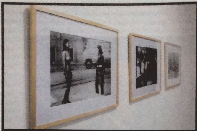
EW A PARTUM FOTÓI

Az idei Off másik címe ( Gaudiopolis 2017 – az öröm városa ) egy konkrét, magyarországi gyerekköztársaságra utal – a kurátorcsapat pontosan ezért támaszkodott egy pozitív, az egyéni felelősségvállalást, a demokráciát és a közösségépítést kiemelő példára. Az OSA Archivumban bemutatott anyag az 1946 és 1950 között működő, Sztéhlo Gábor evangélikus lelkész által létrehozott, vallástól, társadalmi hovatartozástól és nemzetiségtől függetlenül