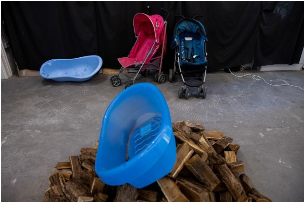
2B Galéria / PAD / Hétköznapi hiányok

Az intézményenkívüliség, kreativitás mindenesetre az OFF-Biennálén megjelenő művészközeg önképének is szerves része, kiegészítve egy nagy