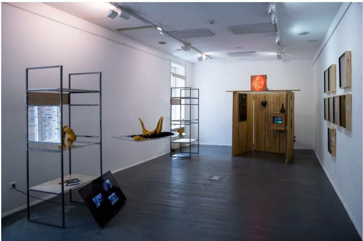
A.P.A Galéria / Klímaképzeleti Ügynökség

Az OFF a 2014-es indulás óta a maga szegmensében nemzetközi tényező lett.