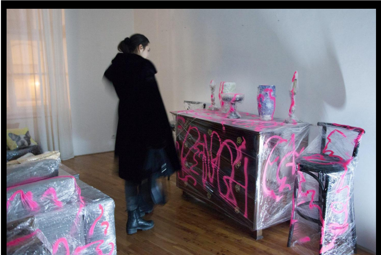
Kiállításenteriór a Flat Galériában, Pozsonyban a dsk. H87kôoşú!% című kiállítás megnyitóján.