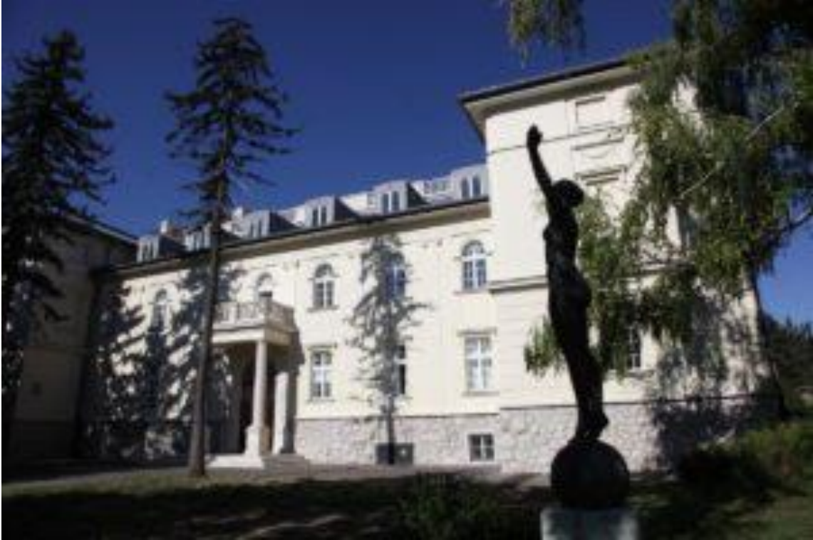
MTA Konkoly-Thege Miklós Csillagászati Kutatóintézet.