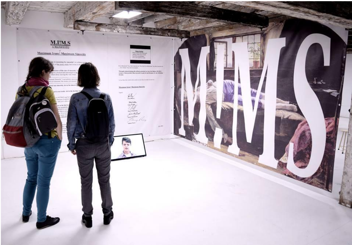
Forecasting a Broken Past, kiállítás interiőr.