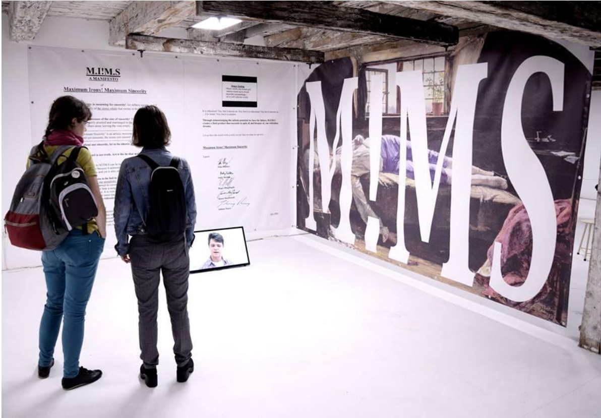
Forecasting a Broken Past, kiállítás enteriőr.