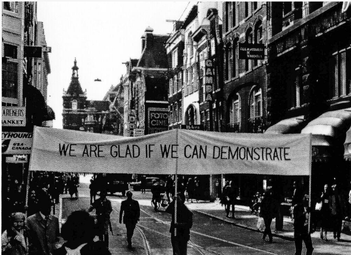
Tót Endre: Örömdemonstráció, Amsterdam, 1979 Endre Tót: Gladness Demonstration, Amsterdam, 1979

Október elsején este héttől nyílik az Aki bújt, aki nem című kiállítás a volt központi Mikrofilmarchívumban (1054 Hold utca 6.) A Kis Varsó művészpáros jegyezte Rebels c. anyag témája a Magyar Képzőművészeti Főiskolán 1989–90 fordulóján zajló változások bemutatása. A diákok tüntetéssorozatba kezdtek, lázadva az elavult, akadémista szemléletű oktatás és az intézmény államszocialista struktúrája ellen. Az ott történt események jól modellezik a politikai rendszerváltásban működő konfliktusokat és érdekérvényesítő mechanizmusokat. A Rebels című projekt részeként a Kis Varsó ezt a történetet egy fotó-képregény és egy új installáció formájában is bemutatja. A tárlat november 5-ig látható.