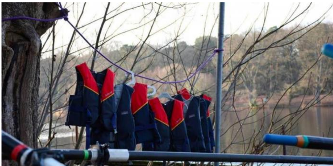
Taking Time

Szombat este Budapesten is megkezdí új évadát az acb Galéria. A Király utcai nagy térben – OFF-programként is futó kiállításon – Gróf Ferenc , az NA-ban Ladik Katalin, az Attachmentben pedig Komoróczy Tamás jelentkezik új művekkel a 19.00-tól 21.00-ig tartó megnyitósorozaton. Komoróczy Megjelenés című bemutatója a művész négy elemből álló, 2017 tavaszán elkezdett kiállítás-sorozatának második állomása. A változatos médiumokat felvonultató kiállítás-sorozat egyes darabjait ugyanaz a gondolatkör ihlette, amelyben kiemelt szerepet játszik Jean-Paul Sartre nagy hatású műve, A lét és a semmi .