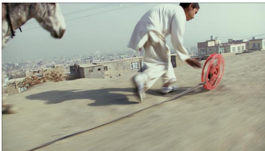
Fotó: Francis Alys

A 2017-es OFF-Biennále ebből a filmklasszikus Valahol Európában-t is ihlető, de valóságos történetből indul ki. Az OSA-ban lesz egy, kifejezetten a Gaudiopolis történetét feldolgozó kiállítás is, de a legtöbb program csak lazán kapcsolódik a pusztuló világban is újjáteremthető szabadság témájához.